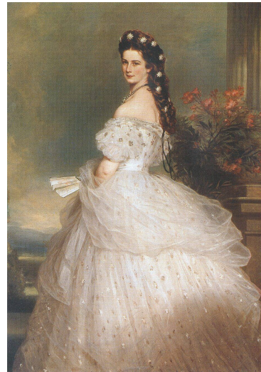
„Elisabeth, Kaiserin von Österreich“; allen bekannt als „Sissi“; 225cmx133cm, 1865

„... Man verehrte den selbstbewussten Künstler in Frankreich, Großbritannien und Russland ebenso wie in Spanien, Portugal und Italien, in Österreich-Ungarn und Deutschland ...“