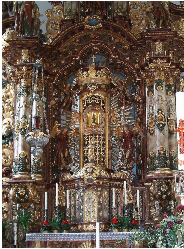
Ausschnitt aus dem Hauptaltar; Wallfahrtskirche, Triberg

„... Man verehrte den selbstbewussten Künstler in Frankreich, Großbritannien und Russland ebenso wie in Spanien, Portugal und Italien, in Österreich-Ungarn und Deutschland ...“