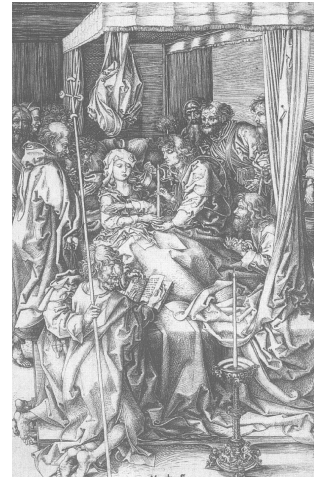
Der Tod Marias; Kupferstich (ca. 26cmx17cm); Das Bild, in das sich Goethe verliebte

"... Seine Kunst kannte keine Grenzen. Er ist ein europäischer Künstler des christlichen Abendlandes..." (aus der Schriftenreihe des Münsterbauvereins Breisach e. V., 1998).