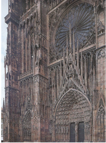
Ausschnitt aus der Westfassade, vollendet im 14. Jhdt.; Münster, Straßburg