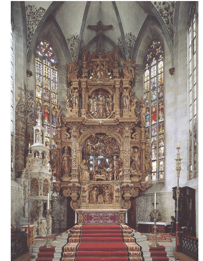
Hauptaltar, Sakramentshaus; Münster, Überlingen